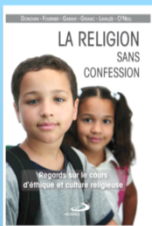
Rassemblement des opinions diverses sur le programme d'éthique et de culture religieuse

L'introduction dans les programmes scolaires d'un enseignement des faits religieux ne semble plus poser de problème. La transmission des données relatives à la pratique religieuse doit demeurer aussi neutre que possible. C'est à ces recommandations que les enseignants doivent en principe se conformer à l'égard de leurs élèves des classes de CE2 jusqu'à la seconde depuis qu'un décret publié en 2006 par le ministère de l'Éducation nationale définit un « socle commun des connaissances et compétences ». Le choix d'intégrer le fait religieux dans ce socle commun (et non dans un enseignement distinct) est une spécificité française, qui est respectée.