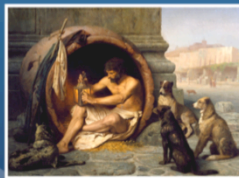
Diogène de Sinope dans son amphore.

Le Centre Civique d'Étude du Fait Religieux (CCEFR) est né de la volonté de donner à chacun les outils indispensables pour connaître et comprendre les faits religieux, en tant que réalités sociales ancrées dans l'histoire de l'humanité.