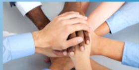
Symbole d'identité et d'unité

L'enseignement du fait religieux constitue l'une des modalités possibles d'un enseignement concernant le religieux. Il résulte de la sécularisation progressive d'un enseignement religieux qui, au départ, était souvent de type confessionnel en fonction du statut reconnu à une religion donnée dans un État.